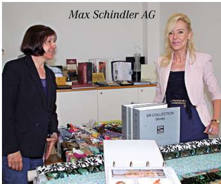
Max Schindler AG