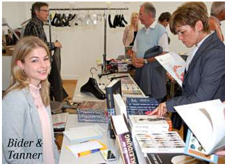
Bider & Tanner