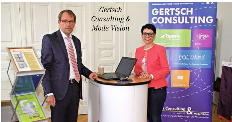
Gertsch Consulting & Mode Vision

Gut besucht war die Mini-Messe des EMTC in der Berufsfachschule Basel. Neben bekannten Stoffhändlern wie Scabal oder Jakob Schlaepfer nutzten auch Accessoires-Hersteller, eine Hutmanufaktur sowie CAD-Experten die Möglichkeit mit ihrer Klientel aus dem Maßschneiderhandwerk ins Gespräch zu kommen.