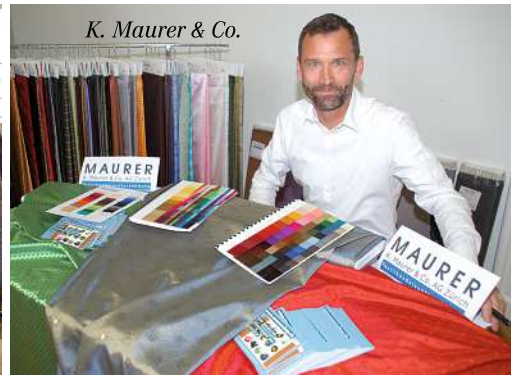
K. Maurer & Co.