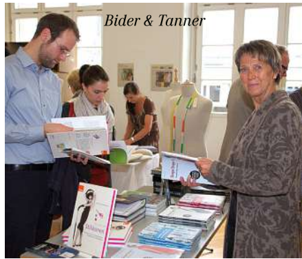
Bider & Tanner